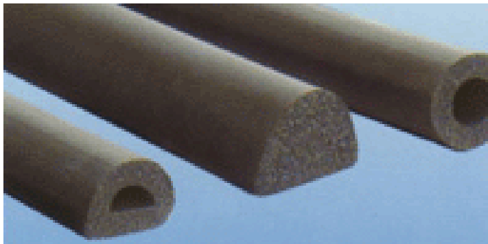
●ボックスカルバート用

サンタックシーラーはブチルゴムを主材としたテープ状のコンクリート二次製品用シール材です。抜群の耐候性があり、高機能な止水材です。